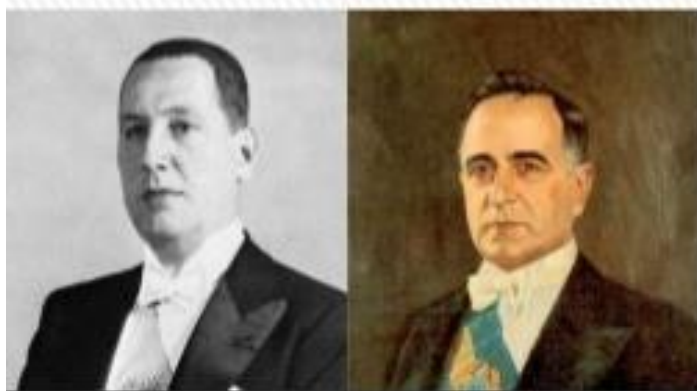
Juan Domingo Perón